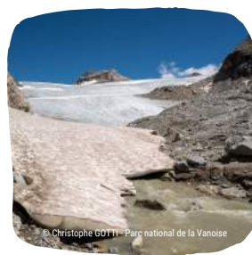
Torrent issu du glacier de Rhèmes-Golette, après la vidange partielle du lac glaciaire