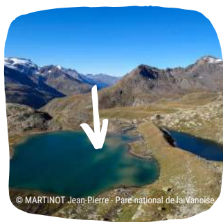
Lacs blanc (à gauche) et noir du Carro en 2001 et 2019

Il rejoint donc le lac blanc du Carro qui a connu cette déconnexion il y a quelques années, suite à la quasi-disparition du glacier de Derrière-les-lacs et à la formation de plusieurs petits lacs dans les moraines supérieures qui jouent un rôle de filtre (bassins de décantation). Le lac a donc perdu sa couleur laiteuse, liée au transport de fines particules dans les eaux de fonte glaciaire, pour un bleu turquoise.