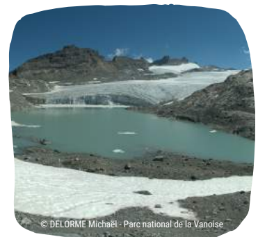
Lac du Grand Méan (lac polaire)

Les modifications de l'hydrologie dans les bassins versants pourraient également modifier le régime thermique des lacs.