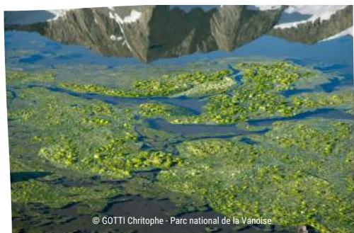
Algues à la surface du Lac des Échines

Avec l'augmentation des températures, la couverture de glace fond plus rapidement, ce qui permet par exemple au phytoplancton de se développer plus tôt (Jacquemin, 2019).