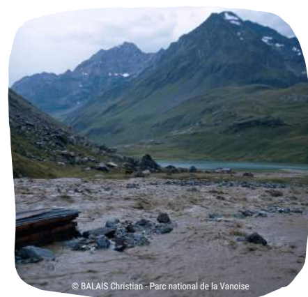
Torrent au refuge d'Entre le Lac et au Lac de la Plagne, formé après un orage

L'apport en eau se fait également via les précipitations sous forme de pluie. Toute modification du régime des précipitations pourrait ainsi perturber l'alimentation en eau des lacs. Actuellement, les modèles climatiques ne prédisent pas de modifications majeures de la pluviométrie générale (Woolway et al., 2020). En revanche, une augmentation des phénomènes extrêmes est prévue , notamment des orages et des tempêtes qui deviendront plus fréquents. Ces changements pourraient aussi impacter le régime hydrologique et thermique des lacs (Jacquemin, 2019 ; Woolway et al., 2020).