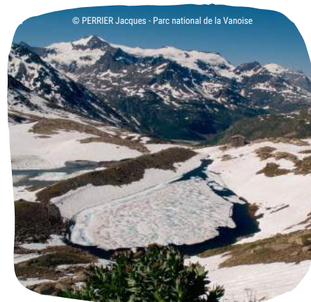
Lacs du Carro en phase de dégel

Ces phénomènes s'accompagnent souvent d'une augmentation de la matière organique, d'une désoxygénation des eaux profondes, d'une perte de la valeur paysagère, voire de risques de production de toxines, etc. (Jacquemin, 2019 ; O'Reilly et al., 2015).