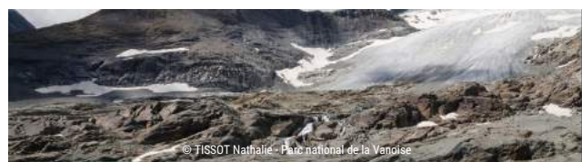
Lac et glacier de l'Arpont (de haut en bas : 1996 - 2004 - 2016)