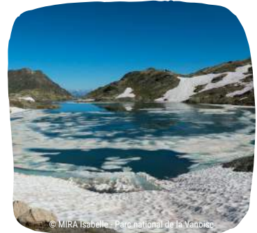
Lac du Mont coua (lac froid)