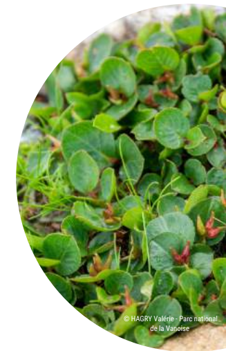
Saule herbacé, espèce typique des combes à neige

On observe également des déplacements « horizontaux » au sein d'un même étage de végétation. Des espèces d'habitats voisins colonisent petit à petit de nouvelles surfaces (Bret, 2016 ; Cannone & Pignatti, 2014). Ce déplacement est particulièrement marquant pour les communautés des combes à neige où de nouvelles espèces, typiques des pelouses alpines avoisinantes, s'installent progressivement tandis que la présence d'espèces typiques des combes à neige se fait plus rare (Matteodo et al., 2016).