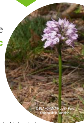
Orchis à trois dents

C'est par exemple le cas de l' Orchis à trois dents ( Neotinea tridentata ), une orchidée que l'on retrouve habituellement en plaine, que l'on peut aujourd'hui observer à Termignon, ou de l' Orchis bouc ( Himantoglossum hircinum ) d'ordinaire plus méridional, présent sur Peisey-Nancroix.