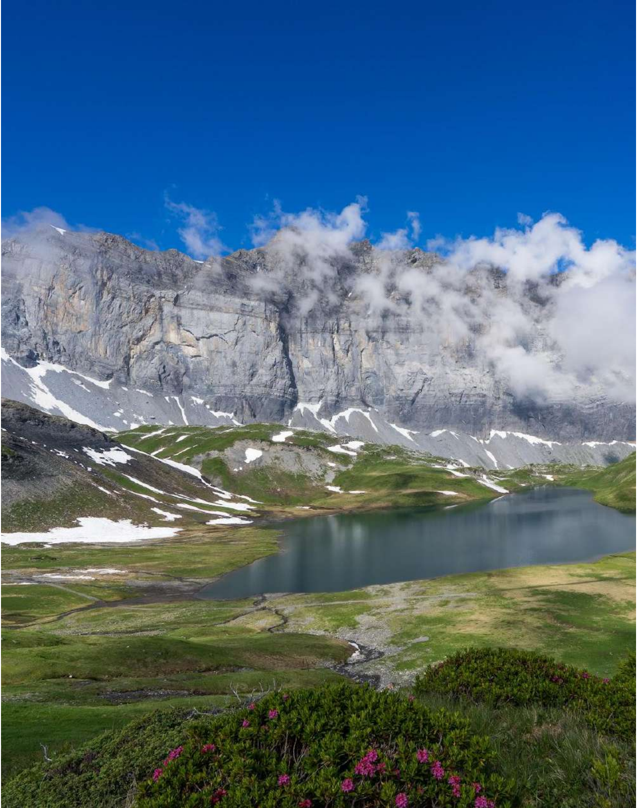
Massif des Fiz et lac d'Anterne